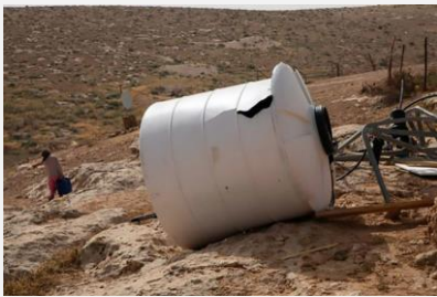
Een van de door Israël vernielde watertanks

Naar vergoeding van de aangerichte schade kunnen Nederland en de EU fluiten. Dat blijkt uit antwoord op Kamervragen die werden gesteld naar aanleiding van de sloop van een Nederlands hulpproject in het Palestijnse dorpje Al-Mirkaz.