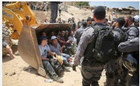
Palestijnse bewoners moeten wijken voor uitbreiding van een joodse nederzetting.