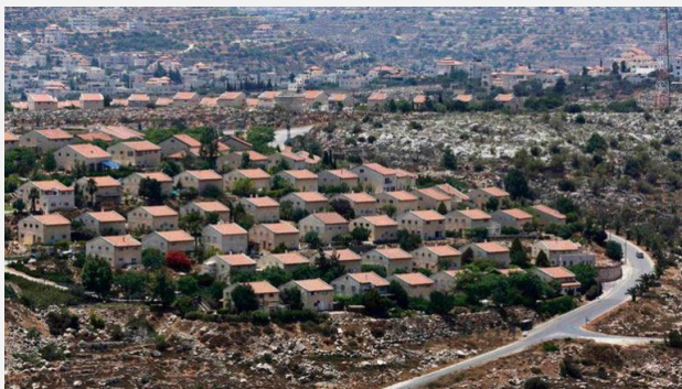
illegale joodse nederzetting

Juist aan die straffeloosheid zou met de oprichting van het Strafhof een eind worden gemaakt, stellen de organisaties onder verwijzing naar het oprichtingsstatuut, het Statuut van Rome. Het is de allerhoogste tijd dat ook de Palestijnen de bescherming krijgen waarop zij recht hebben.