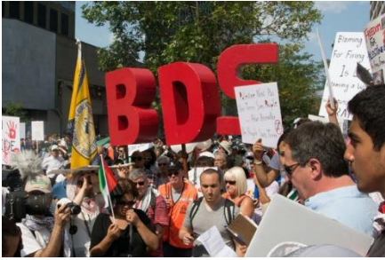
Demonstratie van de beweging voor Boycot, Desinvestering en Sancties (BDS) in Montreal, Canada.

De geheime operatie kwam gisteren aan het licht.